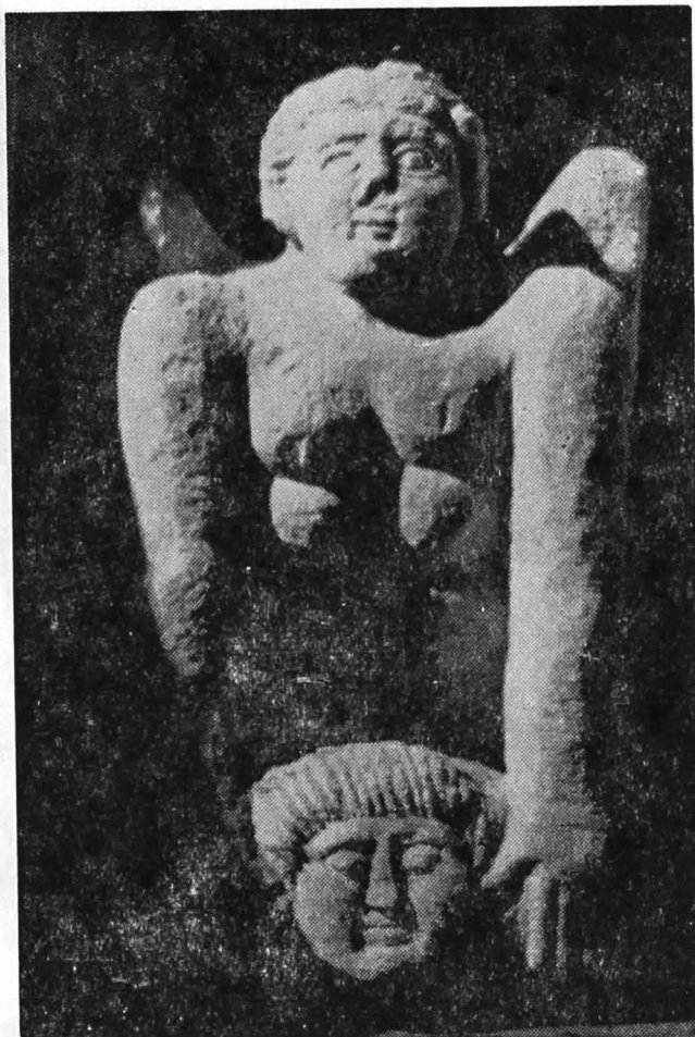
Fig. 5. Un sfinx din Alba Iulia cu capul defunctului.

Al doilea monument care are o importanță și mai mare pentru arta din Dacia este grupul dionysiac găsit în mitreul de la Walbrook, confecționat din marmură italică și datat la mijlocul secolului al III-lea e.n. (fig. 6). Acest grup dionysiac prezintă o asemănare uimitoare cu cel din Turda (fig. 7). Figura centrală este Bacchus nud, ținând capul spre dreapta, ca și cel din Turda, mina dreaptă o ridică în sus, ținând cu ea un șarpe. La dreapta lui Bacchus, sub trunchiul unui arbore se află Silenus stînd călare pe un măgăruș, jumătate gol, ținând cu ambele mâini o cupă cu vin. Deasupra lui, agățat pe copac este Pan, însă într-o stare deteriorată. La stînga lui Bacchus se află un Satyr care-l prinde de spate. La stînga lui stă o menadă, îmbrăcată cu o haină lungă, ținând o cista mystica , o casetă tainică, iar între aceste două figuri stă culcată o panteră privind spre Dionysos.