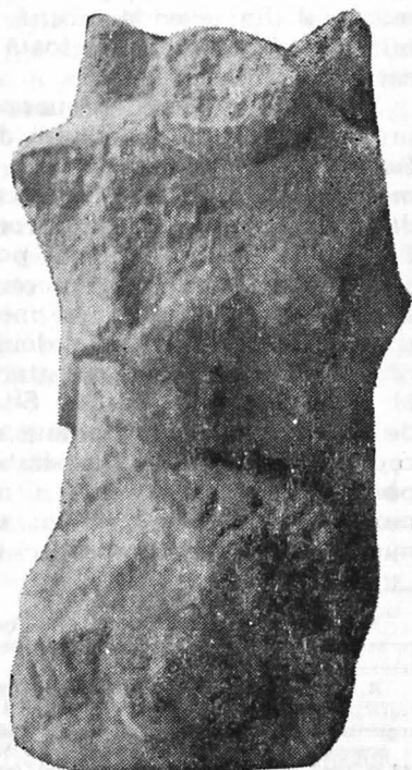
Fig. 4. Un sfinx fără cap de meduză de la Muzeul din Deva.