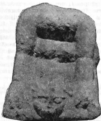
Fig. 3. Un sfinx cu cap de meduză de la Muzeul din Deva.