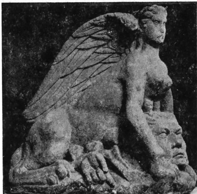
Fig. 1. Sfinxul descoperit la Walbrook.