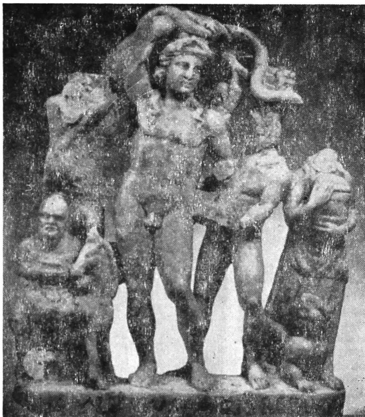
Fig. 6. Grupul dionysiac de la Walbrook.

se văd lângă capul zeului, gravate printr-o reliefare subțire pe fundal. Din stînga celui care privește este un trunchiu de copac pe care se agață Pan cu barba, ținînd un syrinx (fluierul lui Pan). La piciorul copacului este Silenus, jumătate îmbrăcat, chel, în acest caz nu călare pe un măgăruș, ci mergînd cu ajutorul unui băț, spre dreapta. Pantera stă culcată pe partea dreaptă, în spatele piciorului stîng al zeului și privește spre stînga, către stăpînul său. Menada lipsește, dar Satyrul loial este prezent, pășind spre dreapta, purtînd o manta scurtă și ținînd pedum (bîta de păstor încovoiată de aruncat) în mîna stîngă, iar cu mîna dreaptă spatele lui Bacchus, a cărui mîna stîngă este aruncată peste umerii lui. Pe relieful din Bulgaria, Pan se agață în colțul superior al trunchiului de copac, dar sub el o menadă bate timpanum (tamburina), iar un Satyr jucînd cu pantera ia locul lui Silenus. În extrema stîngă apare menada cu cista mystica , pe cînd Bacchus își ridică mîna încolăcită de șarpe deasupra capului și poartă o nebris .... Este probabil că șarpele pe toate aceste scene simbolizează pe mortul fericit.