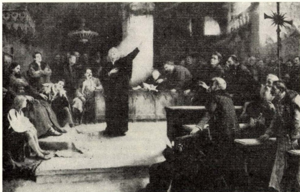
Kőrösfői Kriesch Aladár: A tordai országgyűlés, 1568

Ilyen körülmények között Blandrata úgy viselkedik, mint jó diplomata. Meg van győződve, hogy a fejedelmi indulat megenyhítése áldozatot követel. Ezt csak Dávid Ferenc hozhatja meg, ha lemond makacsul védett újtásáról. A modern történetírás