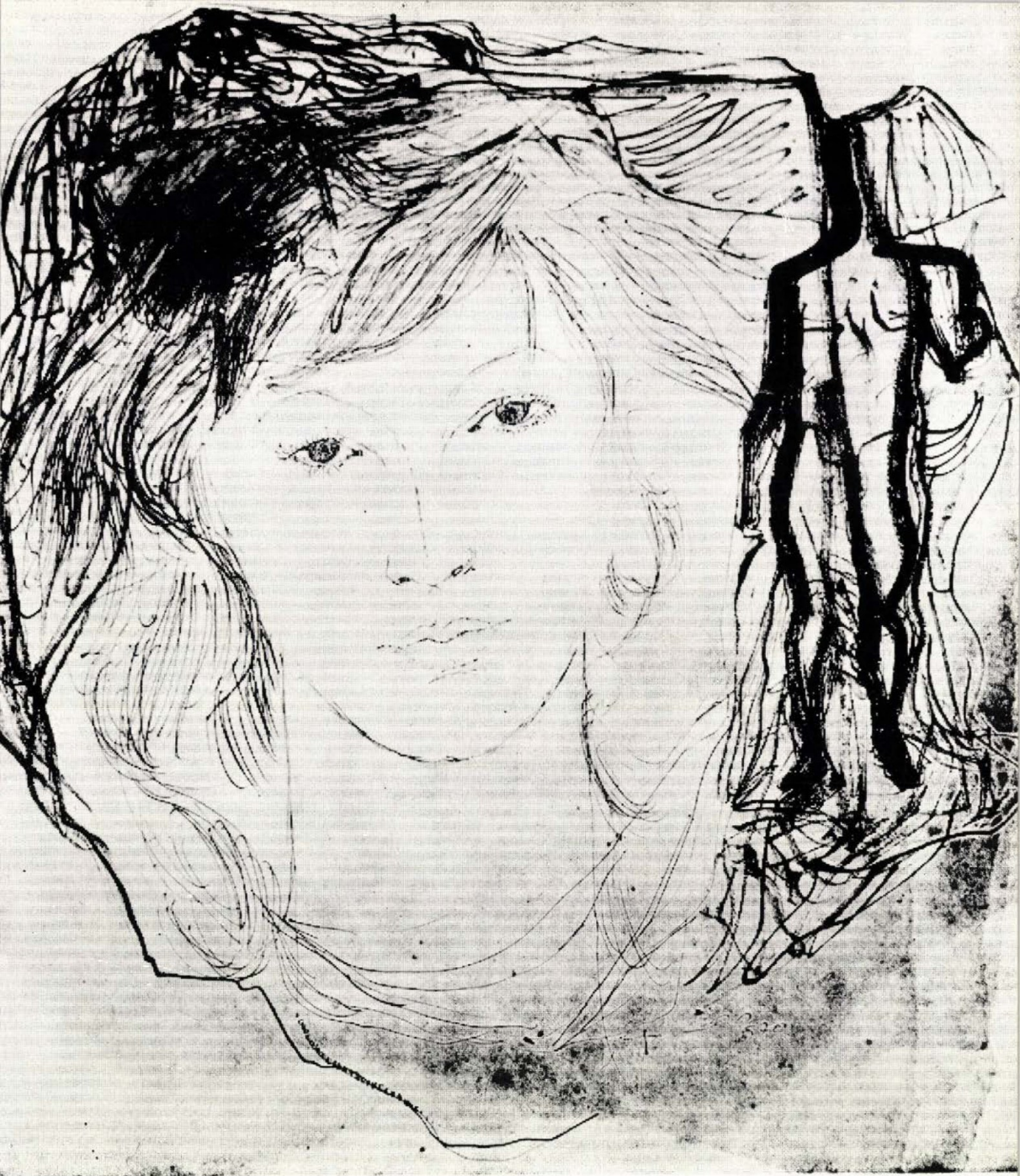
ERDOS I. PAL: 1. IFJUSAG; 2. UTAZAS; 3. LEGENDA