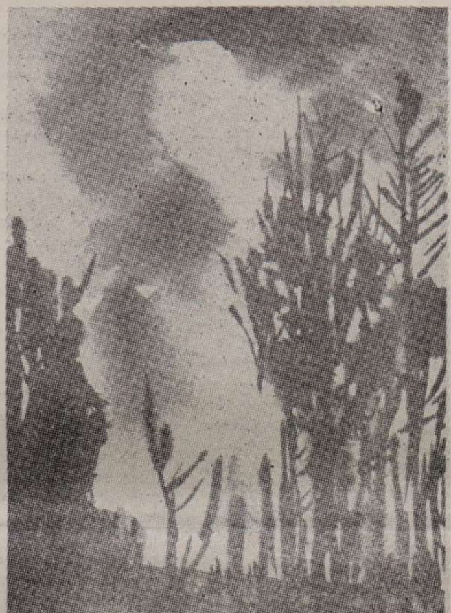
Balogh Lajos: Tavasz fények