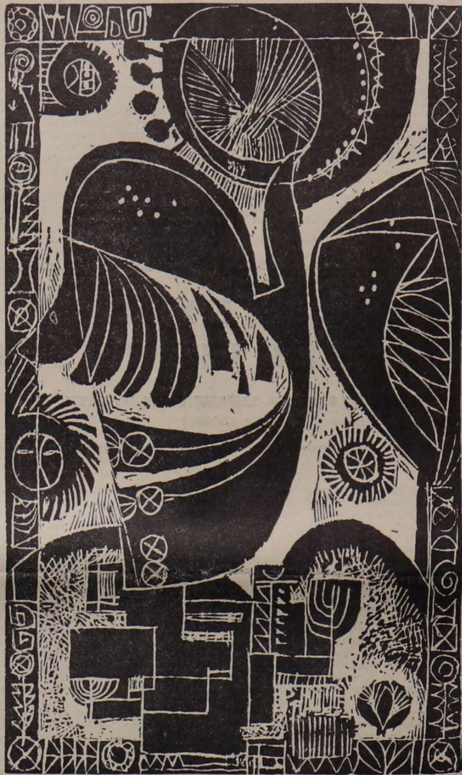
Arkossy István fametszete