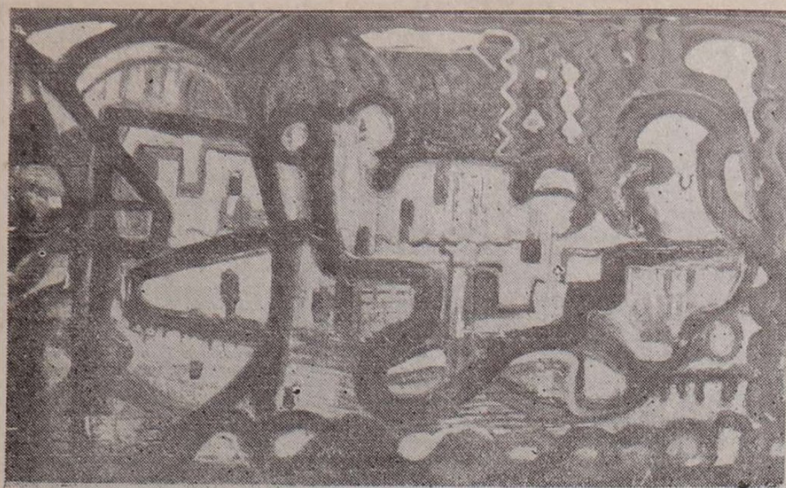
Kulcsár Béla: Barokk város