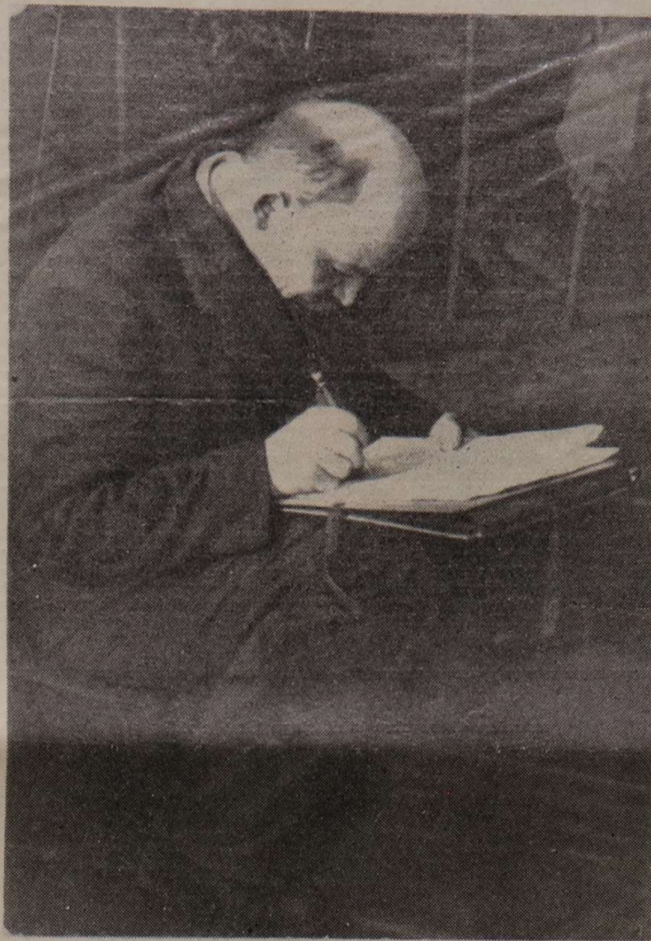
Moszkva, 1921 június